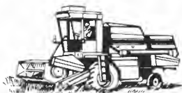
SAMPO skurtreskere med 9 til 11 fots skjærebord.

traktorer med 2 eller 4 hjuls trekk fra 30 HK til 125 HK.