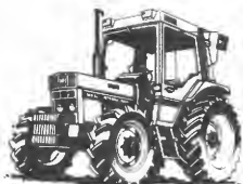
INTERNATIONAL HARVESTER traktorer med 2 eller 4 hjuls trekk fra 30 HK til 125 HK.