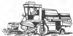
SAMPO skurtreskere med 9 til 11 fots skjærebord.