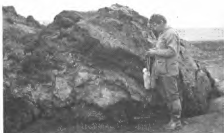
Torvflak fra Adventdalen.