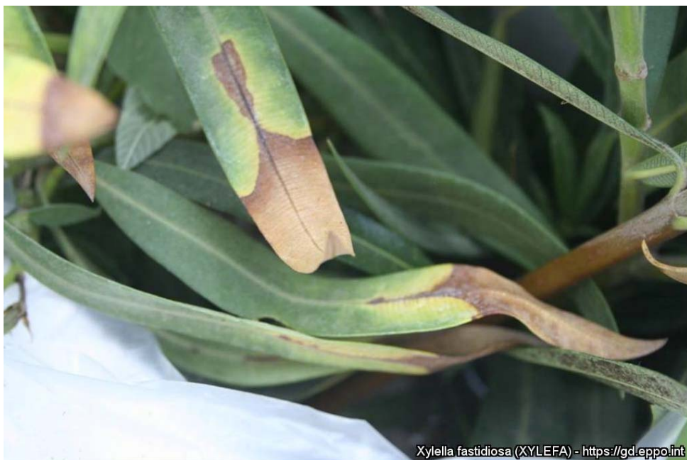
Nerium oleander - oleander