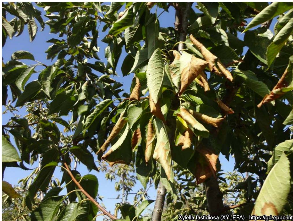
Prunus avium – morell