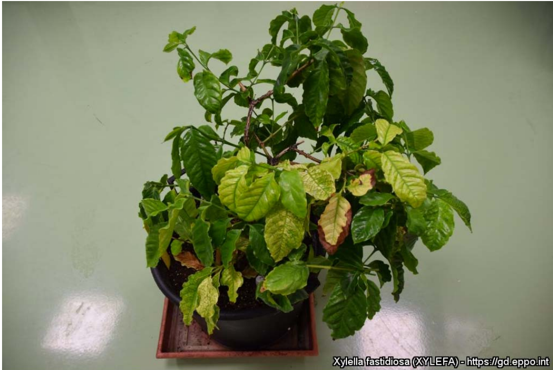
Coffea arabica – kaffe