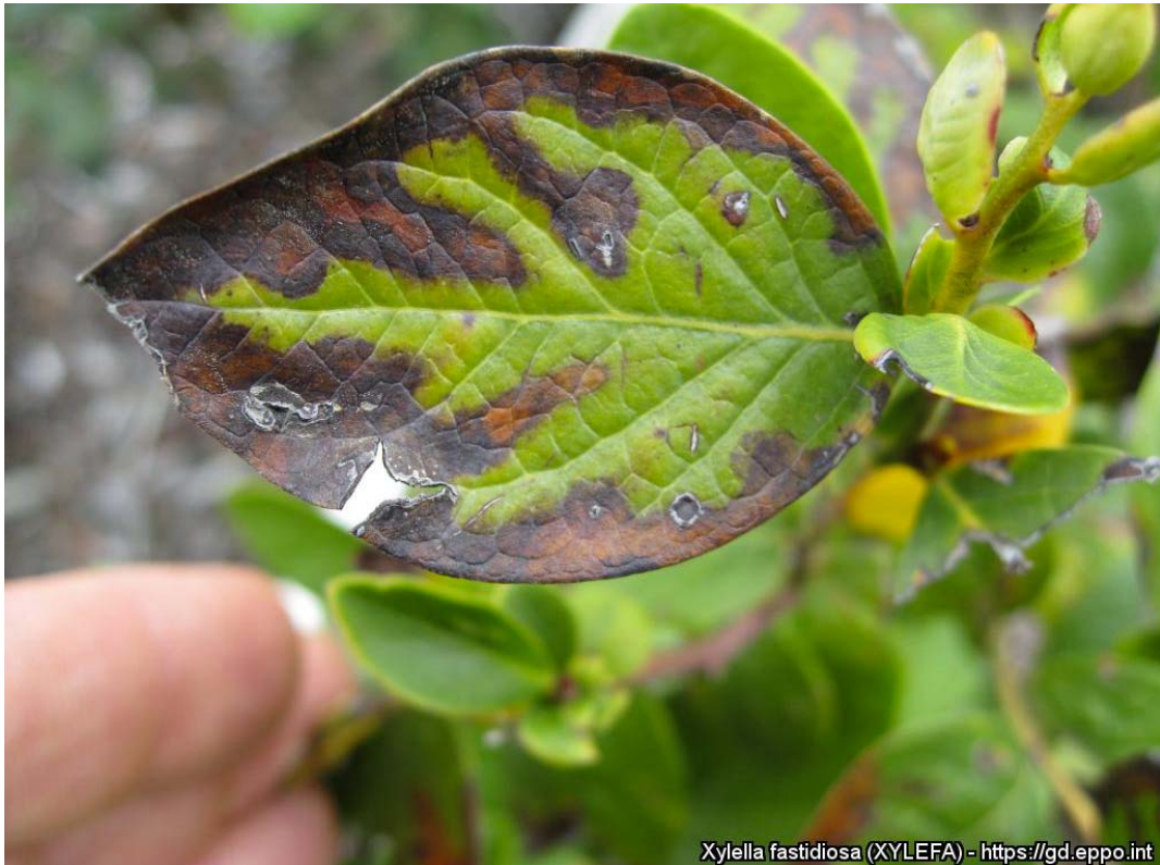
Vaccinium corymbosum - hageblåbær