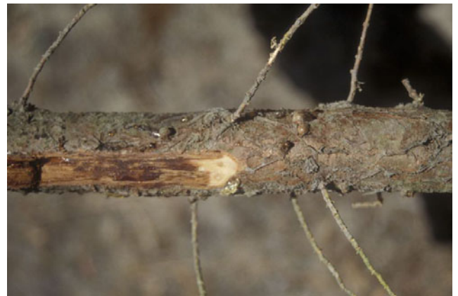
Fig. 4. Under barksprekken på denne Cupressus macrocarpa var vevet misfarga og greina ringa på grunn av angrep av Seiridium . New Zealand, februar 2003.