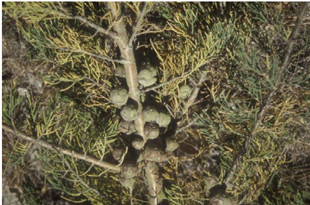
Fig. 2. Cupressus macrocarpa som har vorte gul i baret på grunn av at greina er i ferd med å verta ringa av kreftsår etter angrep av Seiridium . New Zealand, februar 2003.

I 2000 vart det rapportert at sanitære tiltak som fjerning og destruering av infiserte greiner og sterkt infiserte tre, i tillegg til bruk av kjemiske middel, ikkje såg ut til å dempa Seiridium -epidemien i Europa. Dei beste resultatata var oppnådde ved resistensforedling. Frå 1990 har fire klonar av syress, som er resistente mot Seiridium -kreft, vore kommersielt tilgjengelege i Europa (patenterte).