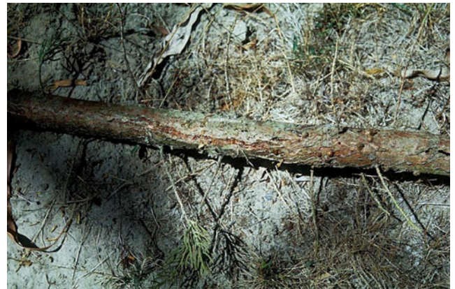
Fig. 3. Cupressus macrocarpa med sprokken bark på grunn av angrep av Seiridium . New Zealand, februar 2003.