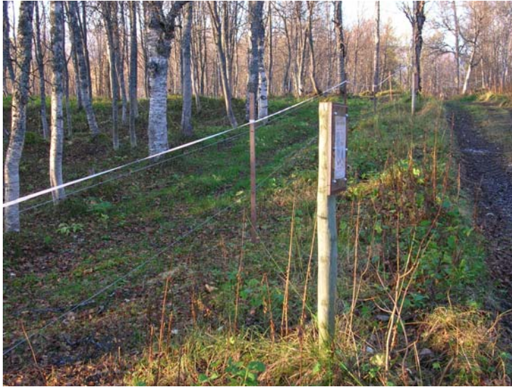
Inngjerdet hestebeite. Tydelig resultat av beiting mellom utside og innside gjerde. Informasjonsskilt og sti til høyre.

for å stoppe gjengroinga og få tilbake det gamle beitelandskapet. Ridestallen på Åsgård er også fornøyd med å ha tilgang til alternative beitearealer i nærhet av stallen.