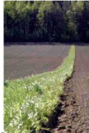
Kunstig laget åkerkant i en større åker.

Åkerkantene er på flere måter et viktig habitat for nyttefaunaen i jordbrukslandskapet. Som nevnt tidligere er det bl.a. mange viktige predatorer som overvintrer der (Sotherton 1984). Det skyldes først og fremst at mikroklimaet der er gunstigere enn ute i åkeren. Åkerkanter med stort biologisk mangfold er også viktig for å gi predatorene tilgang på byttedyr tidlig på våren. En del predatorarter holder seg i nærheten av åkerkanten også utover sommeren. Andre arter beveger seg langt utover i åkeren igjen om sommeren for å spise insekter der. Åkerkantene er også viktige leverandører av pollen og nektar for andre nyttedyr som snylteveps og blomsterfluer. For jordbruket er det altså viktig å ha åkerkanter som er gunstige for skadedyrenes naturlige fiender. Større åkre kan en dele opp ved å anlegge 2 m brede grasstriper for å øke overvintringsmulighetene for predatorene.