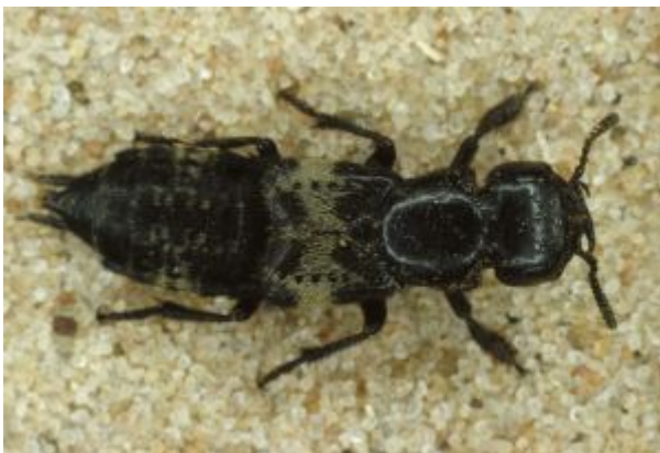
Kortvinge ( Creophilus maxillosus )

Kortvingene er ikke så godt undersøkt som løpebillene, men har stor betydning som naturlige fiender særlig for egg og larver av mindre skadedyr i grønnsaker og jordbruksvekster.