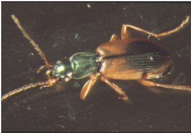
Løpebille ( Agonum dorsale )

Sørøst-Norge, og er i dag en til dels dominerende predator i jordbruksområder i Østfold, Vestfold, Akershus, Buskerud, Telemark og Aust-Agder (Andersen 1996). For om mulig å øke hastigheten i spredningen innen Norge ble det satt ut (norske) biller av denne arten ved Sandnes, i Lærdal, ved Molde og på Frosta i 1991-92. Bortsett fra ved Molde ble arten funnet igjen i utsettingsområdene 3-4 år seinere, noe som kan indikere at arten reproduserte i utsettingsområdene. Det blir spennende å følge med på hvor langt utbredelsen her i landet vil bli for dette nyttedyret!