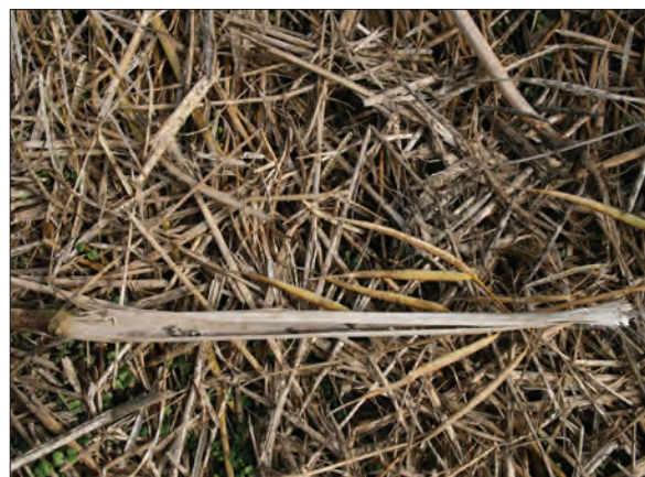
Bilde 4. Stengel av rybs med flere sklerotier av storknolla råtesopp. Noen av disse vil havne i avlingen ved tresking.

En faktoriell statistisk analyse av de behandlede ledene for de 4 forsøkene med sklerotier i avlingen, viser en klar tendens til økt avling og økt frøstørrelse ved øking av vannmengden fra 20 til 40 l per dekar (figur 1). For frøstørrelsen kunne en påvise et samspill