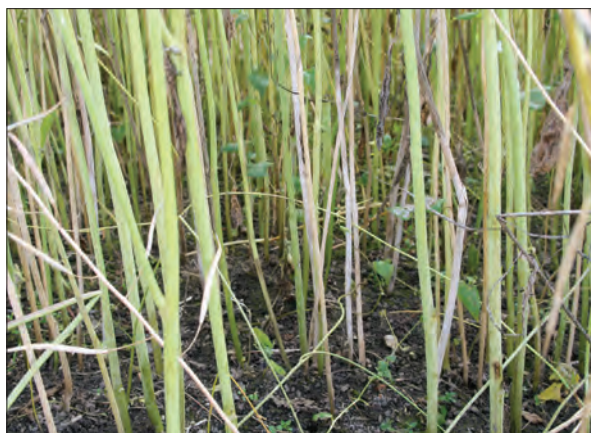
Bilde 3. Visne stengler i raps forårsaket av storknolla råtesopp.