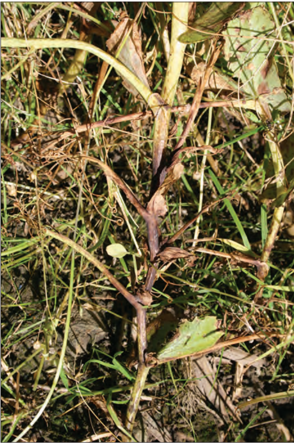
Bilde 6. Erteplante i en åker med mye legde. Skadene kan tyde på angrep av soppen Mycosphaerella pinodes .

for soppbekjempelse har ikke hatt noen sammenheng med bestandshøyden ved høsting. I noen av feltene der erteriset har ligget nesten flatt (15 cm plantehøyde) ved høsting, har soppbekjempelse gitt stor meravling, i andre felt ikke. Dersom plantehøyden ved høsting er svært lav, vil en normalt få en del tresketap. Ertene kan også ha vært utsatt for sterke sjukdomsangrep. En vil normalt få mindre høstetap