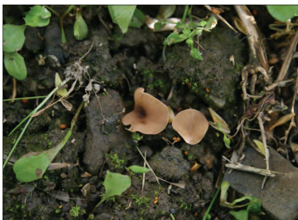
Bilde 2. Skålforma «hatter» (apothecier) fra spirende sklerotier. I fuktig vær utvikles og spres sporer fra apotheciene

flekker på blader og belger. Mycosphaerella pinodes ( Ascochyta pinodes ) kan forårsake sterke angrep på både stengel, blader og belger. Phoma medicaginis var. pinodella ( Ascochyta pinodella ) forårsaker hovedsakelig fotsjuka. Alle tre soppene spres med frø i tillegg til å overleve på planterester. Angrep utvikles raskt i fuktig vær. Særlig M. pinodes kan forårsake skade/mørkfarging av stengelen litt ut i sesongen. Ved fuktige forhold i et frodig plantebestand kan soppen drepe plantene (ses som uttørking/tvangsmodning) og forårsake legde, som vanskeliggjør tresking og kan gi betydelige avlingstap. Det er ingen krav i såvareforskriften angående frøsmitte av erteflekk/ertefotsjukekomplekset.