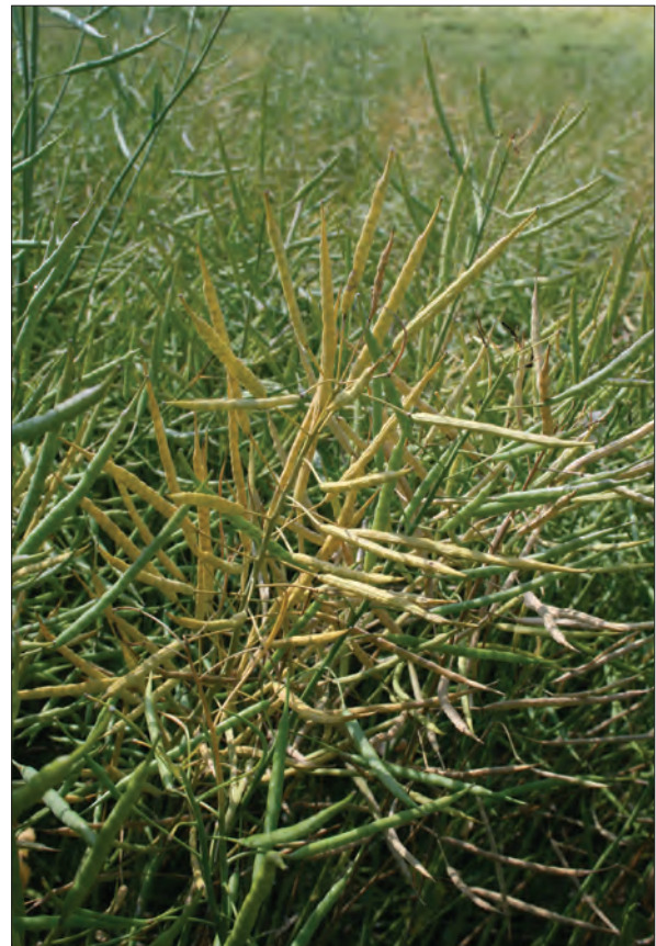
Bilde 1. For tidlig modning forårsaket av storknollet råtesopp i rapsåker.

Erteflekk/ertefotsjuka-komplekset forårsakes av tre sopper. Ascochyta pisi forårsaker først og fremst