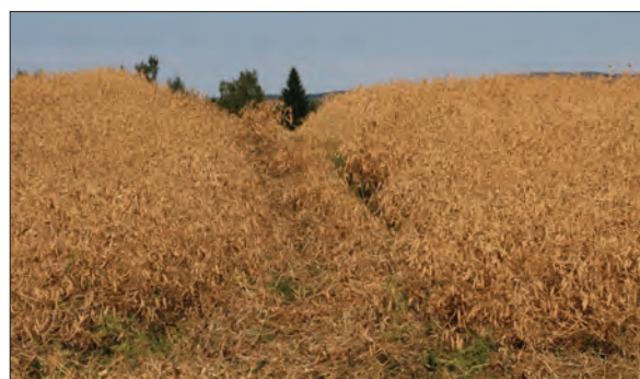
Bilde 5. Stående høstklar erteåker i 2013.

Avlingsøkningen varierte mye fra felt til felt i denne periode, fra ingen til opptil 40 prosent avlingsøkning for soppbekjempelse. I gjennomsnitt har en oppnådd 7 prosent større avling. Det har ikke vært noe sikker