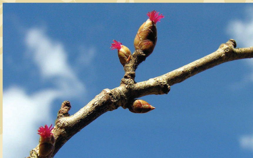
Hunnblomster hos hassel.

Lindetrær kan bli over 500 år gamle og 30 meter høye. Hassel blir bare 60–80 år og er en busk eller et lite tre på rundt 8 meter. Hassel kan blomstre så tidlig som i februar, mens lind blomster senest av alle løvtrærne i juli.