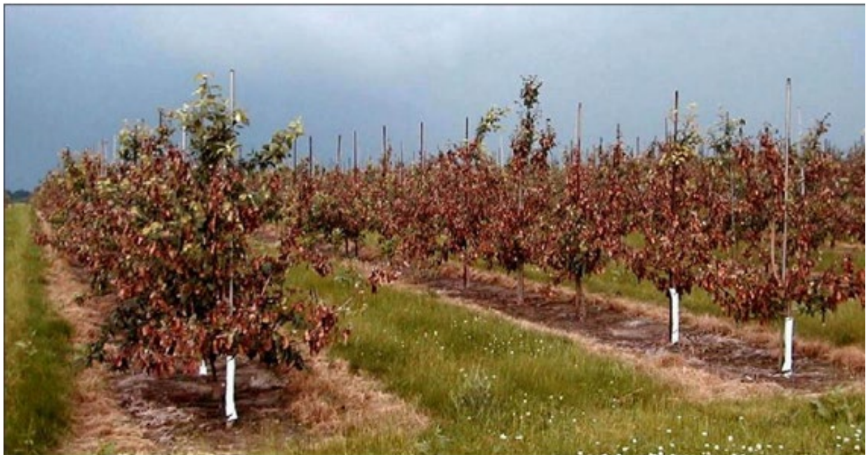
Graverende symptomer på epletrær.