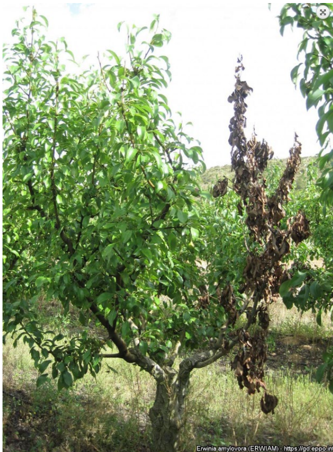
Symptom på pæretre.