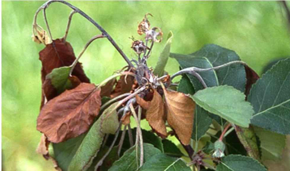
Symptom på skudd og blomster av eple