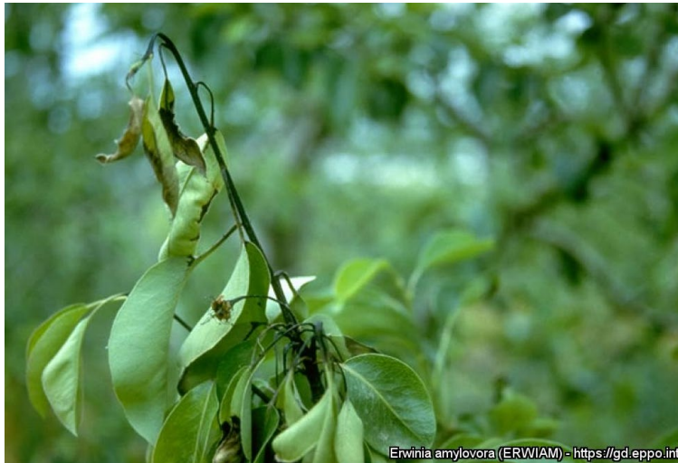
Symptom på skudd av pære.