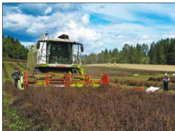
Bilde 1. Frøspillforsøket i rødkløver ved tredje tresketid, 24. august kl. 13.

Forsøket ble gjennomført 23-24. august ved tresking av Lea rødkløver i Høyjord, Sandefjord, Vestfold (bilde 1). Frøenga var svidd med Reglone, 0,33 l/daa, 2. august. Treskeren var en Claas Lexion 630 med 5,40 m breit skjærebord. Framdriftshastigheten var konstant 1,0 km/t, slagerens periferihastighet 30 m/s og bruåpninga 7 mm foran og 3 mm bak. Det ble ikke brukt tinelister. Vifta under sålda gikk med et konstant turtall på 670 r/min.