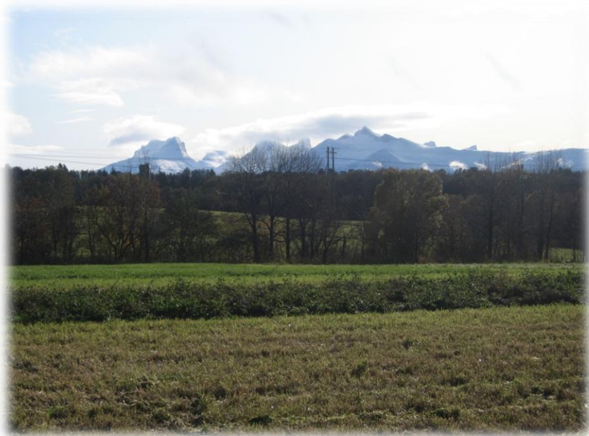
Vågønes i Nordland

I 2007 sådde me ut ei blanding av timotei, engsvingel og raudkløver på fem stader. Blandinga besto av 65 % timotei, 25% engsvingel og 10% raudkløver. Felta er om lag 600 m 2 , med nokre lokale tilpassingar. Felta vart lagt til einingar i Bioforsk, så nær som i Østfold der det er Norsk Landbruksrådgiving Sør Øst som har tatt på seg feltarbeidet. Det viste seg å vere vanskeleg å få så mange felt som ønska. Men i 2008 vart det etablert to felt til, eit på Snåsa i regi av Norsk Landbruksrådgiving Nord-Trøndelag og eit på Alstahaug i regi av Norsk Landbruksrådgiving Helgeland. Det er derfor totalt sju felt med ei rimeleg bra fordeling geografisk. Tabell 1 viser plassering og klima for dei ulike felta