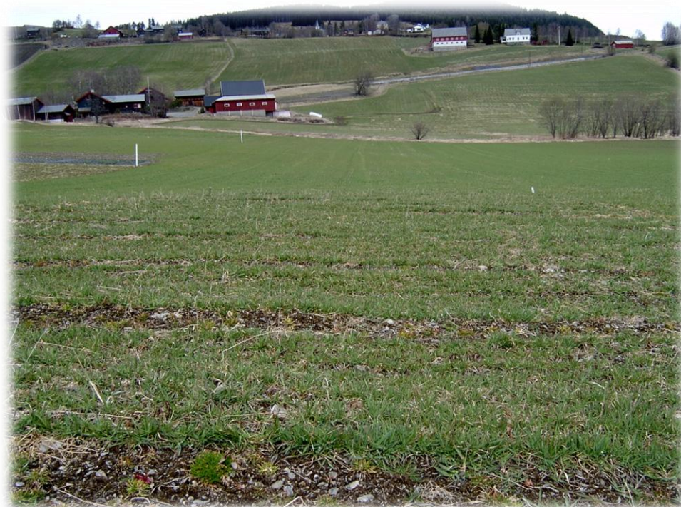
Førsteårsenga i Volbu (Bioforsk Øst Løken) fotografert 4.mai 2012.

I 2012 vart jakta på feltstader intensivert, og også meir målretta. Utvalte skular fekk først tilsendt e-post, deretter telefon nokre dagar seinare med spørsmål om dei hadde fått e-posten. Nokon kunne da straks svare om dei ville vere med på prosjektet som feltvert, medan andre trengte betenkningstid. Dei fleste klarte bestemme seg tidnok til å få tilsendt frø og så feltet. Dei er lista opp i tabell 3. Feltet på Tana vgs vart ikkje sådd før enn i 2012, då med hjelp av Norsk landbruksrådgiving Finnmark. Feltet på Storsteigen vgs blir først sådd i 2013.