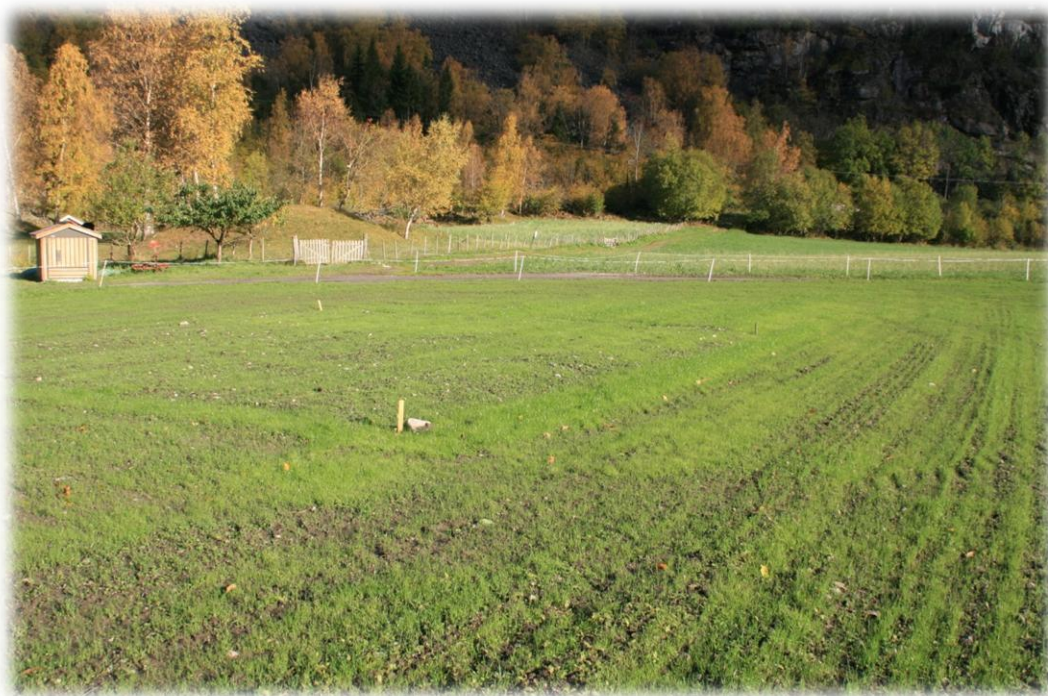
Nysådd felt på Sogn Jord- og Hagebruksskule.

Det har dessverre vore for lite ressursar til å ha mykje kontakt med feltvertane i 2012, utover å overtale dei til å vere med. Det er sannsynleg at ikkje alle har klart å så feltet etter planen, og det trengs meir oppfølging framocver. Samtidig er det no så mange felt at det tar tid å følge opp alle, derfor må det søkast finne effektive kommunikasjonsformer. Det må også bli ein betre dialog med dei ansvarlege for undervisninga for å få formidla prosjektet til elevane på ein god måte. Det er ei utfordring at mange av skulane har gardsdrifta skilt frå undervisninga, og har «satt bort» drifta av arealet.