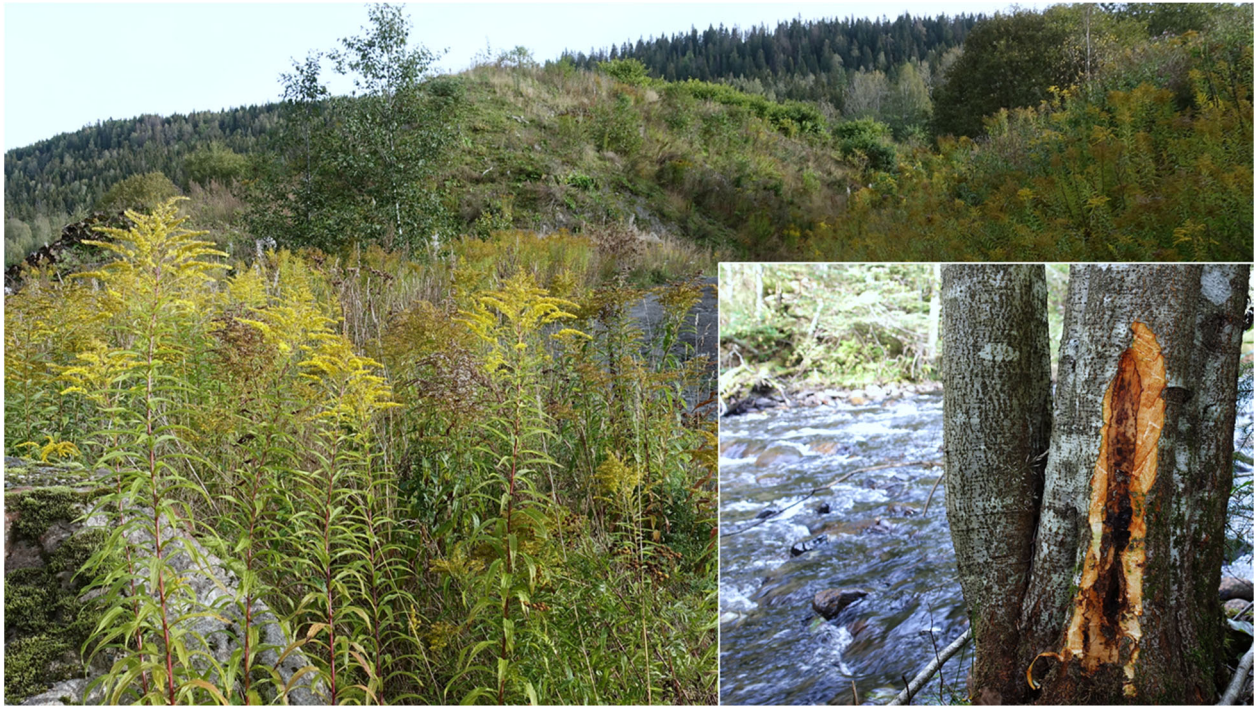
Figur 3. Massedeponi i Sørkedalen. Her ses omfattende spredning av kanadagullris ( Solidago canadensis ), men slike masser kan også inneholde mikroorganismer som Phytophthora og andre uønskede fremmede arter. Langs elva som mottar avrenning fra dette området (Langlielva), så vi tydelige Phytophthora -symptomer på gråor ( Alnus incana ) (innfelt bilde), men det vil kreve omfattende undersøkelser for å fastslå hvorvidt det er Phytophthora -smitte som stammer fra deponiet.