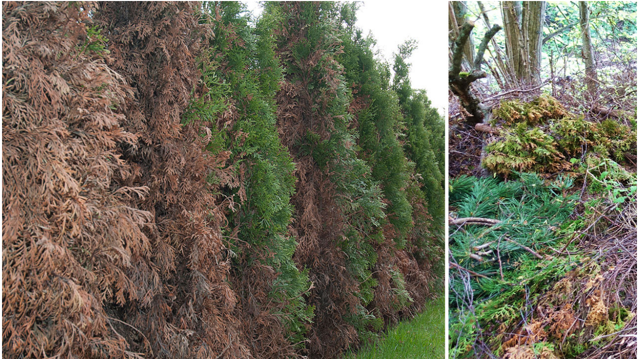
Figur 2. En hekk av tuja ( Thuja occidentalis ) i Oslo i som var infisert av Phytophthora pini (venstre). Til høyre ses rester av sjuk tuja som var kastet sammen med annet hageavfall i en skråning ved Lysakerelva.

Vi har også merket oss at det over tid har foregått deponering av masser i Sørkedalen. Slike masser kan inneholde en rekke arter som det ikke er ønskelig å spre, både fremmede planter og sykdomsorganismer som Phytophthora (Figur 3). Trafikk i forbindelse med massedeponering kan også ha brakt smitte inn i dalen via infisert jord på kjøretøy.