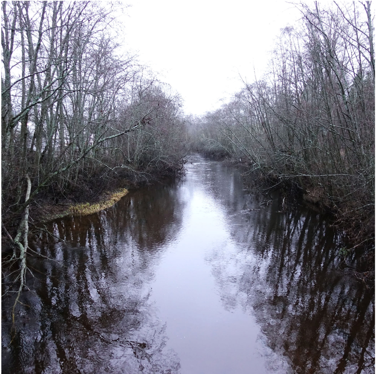
Figur 4. Gråor ( Alnus incana ) er den dominerende trearten i kantsonen til Sørkedalselva.

Med kantsonen mener vi det tredekte området langs elva. Nedover i dalen er kantsonen på begge sider av Sørkedalselva stort sett dekket av et relativt smalt belte med trær der gråor dominerer (Figur 4). Lenger opp i dalen, nord for der Heggelidelva og Langlielva renner sammen til Sørkedalselva, er skråningene ned til vassdraget flere steder brattere og består av berg og ur. Her er det et bredere belte av trær med en mer variert tresammensetning enn nedstrøms, inkludert gran ( Picea abies ).