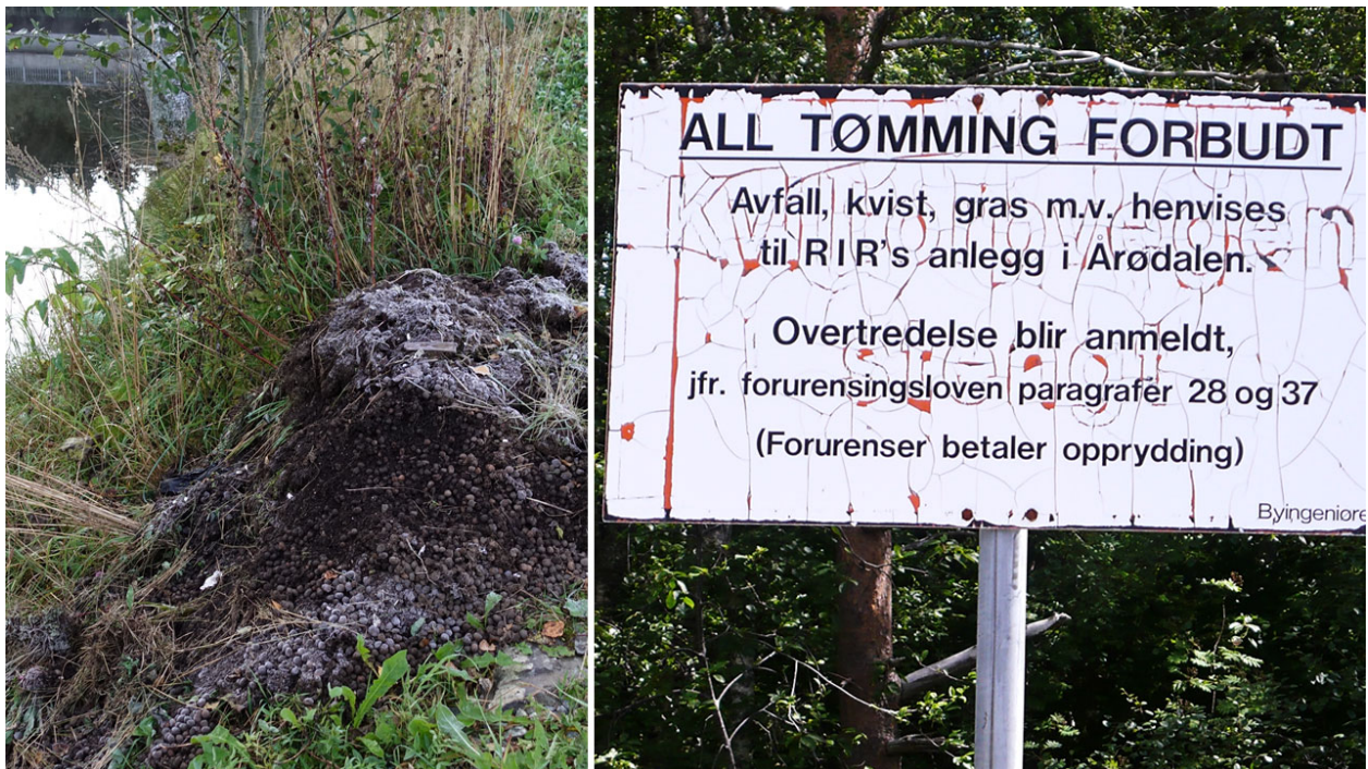
Figur 1. Her var vekstmedium og prydplanterester tømt ved kanten av Sørkedalselva i 2019 (venstre). Skiltet til høyre er et eksempel fra Molde på hvordan publikum kan bli gjort klar over at planteavfall ikke skal kastes i naturen.

En annen smittevei er spredning av hvilesporer som følger med sjuke planter med jordklump dersom de dumpes sammen med annet hageavfall i for eksempel skogkanter eller ved vassdrag. Det siste observerte vi også ved Sørkedalselva under kartleggingen i 2019 (Figur 1 - venstre). Vi gjør oppmerksom på at dette er forbudt ifølge Forurensingsloven (LOV-1981-03-13-6), men ikke alle er klar over dette, og gjør det i god tro for å føre organisk materiale tilbake til naturen. Det er derfor behov for økt informasjon til publikum. For eksempel bør kommunen sette opp skilt noen steder i Sørkedalen slik som det er gjort mange steder i landet (Figur 1 - høyre), men også grunneiere bør slå ned på slik aktivitet dersom det oppdages dumping av hageavfall på deres eiendom og ellers i nærområder. Tuja ( Thuja spp.) er et typisk eksempel på en mye brukt hageplante som ofte er infisert med Phytophthora (Figur 2).