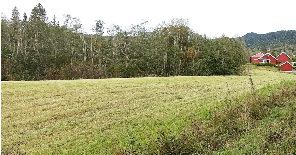
Figur 5. Et godt drenert belte mot kantsonen av vassdrag er med på å hindre sporeproduksjon av Phytophthora , og grasdekket hindrer i stor grad at eventuell infisert jord dras med til andre områder under slått og annen aktivitet. Her renner Sørkedalselva like bak trærne langs jordet.

Vi ser på massedeponiene som er opprettet i dalen som svært uheldige med tanke på faren for introduksjon av både fremmede planter, skadedyr og sjukdomsorganismer. Vi har forstått at dette er masser knyttet til ulike utbyggingsprosjekter i Oslo-området, og det er ukjent hva de kan inneholde av skadegjørere. Generelt er deponier ingen god løsning for Phytophthora -infiserte masser, da de ligger under åpen himmel og vil kunne føre til smittespredning via avrenning. Dersom masser likevel må flyttes til deponier, er det spesielt viktig at de ikke ligger nær vassdrag slik de gjør i Sørkedalen. Oppvarming av massene tilsvarende det som gjøres i en komposteringsprosess, altså høy temperatur (rundt 70 grader) i flere dager, vil kunne drepe Phytophthora , men det er i praksis umulig ved store anleggsarbeider. Et godt filter med duk, sand o.a. i bunnen av deponier vil muligens kunne redusere smittespredning. Det er prøvd ut i mindre skala i renseanlegg for Phytophthora -infisert vann i tyske planteskoler (Ufer et al. 2008). En annen fare ved deponier er at det kan bli et sted der flere Phytophthora -arter ender opp med påfølgende fare for hybridisering mellom arter, dvs. at forskjellige Phytophthora -arter krysser seg og i verste fall gir opphav til mer aggressive arter.