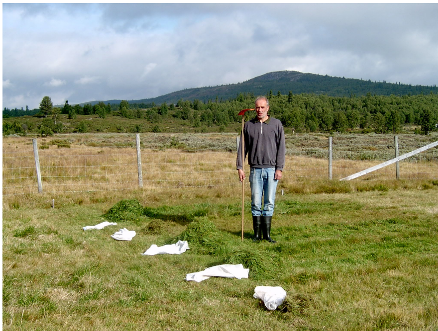
Figur 2. Avling ved ulik gjødsling, andreslått på Rognsfeten 2005. Den nærmaste ruta er ugjødsla, deretter kjem 5 kg N, 10 kg N, PK og 15 kg N/daa.