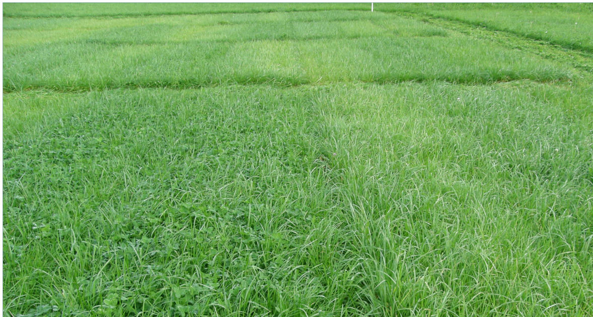
Artsblandingar aukar engavlinga i forhold til reinbestand av dei same artane

Engsvingel er etter timotei den viktigaste arten i ei frøblanding, og i teorien skal engsvingel ta over plassen når timotei går ut. I fjellbygdene viser botaniske registreringar at engsvingel i liten grad utfyller timotei over tid, og at enger eldre enn tre år får inn ein god del ikkje-sådde artar som til dømes kveke (Lunnan og Todnem 2017). Registreringar i Møre og Romsdal viser same resultat (Lunnan pers. medd.). Vanlege frøblandingar til surfôr er baserte på timotei og engsvingel, og dette fører til høgt innhald av ikkje-sådde artar i eldre enger. I Sør-Norge får engsvingel lett angrep av bladfleksjukdom i gjenveksten utan at omfanget er dokumentert.