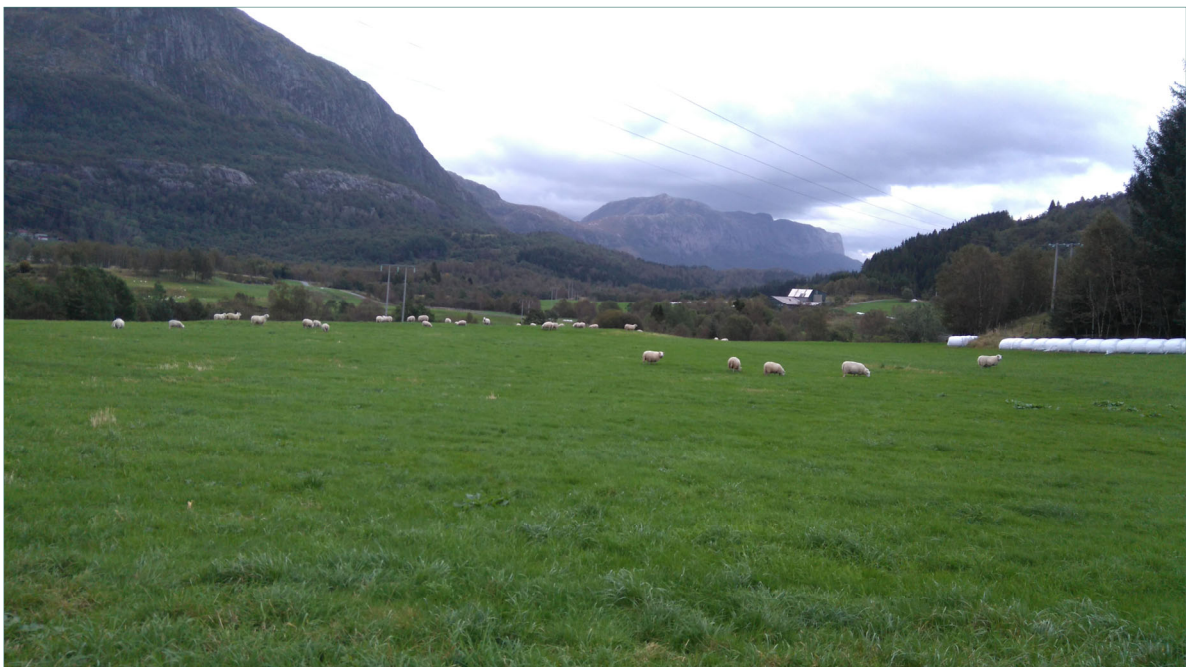
Artar og sortar i frøblandingane må vera godt tilpassa både klima, bruks- og driftsmåte

På bakgrunn av dei til dels store klimaendringane vi ser, og som utifrå prognosar vil auka i tiåra framover, er det grunn til å stilla spørsmål om eksisterande frøblandingar er optimale for dagens grovfôrproduksjon. I tillegg er det store endringar i driftsmåte og -utstyr.