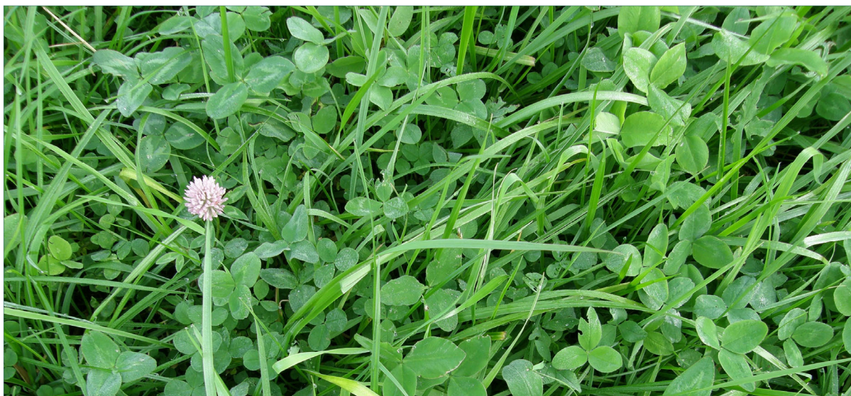
Det er viktig at såmengda gir plantetal som gir rom for utvikling av alle sådde artar og som dekker arealet godt for å hindra ugrasvekst.