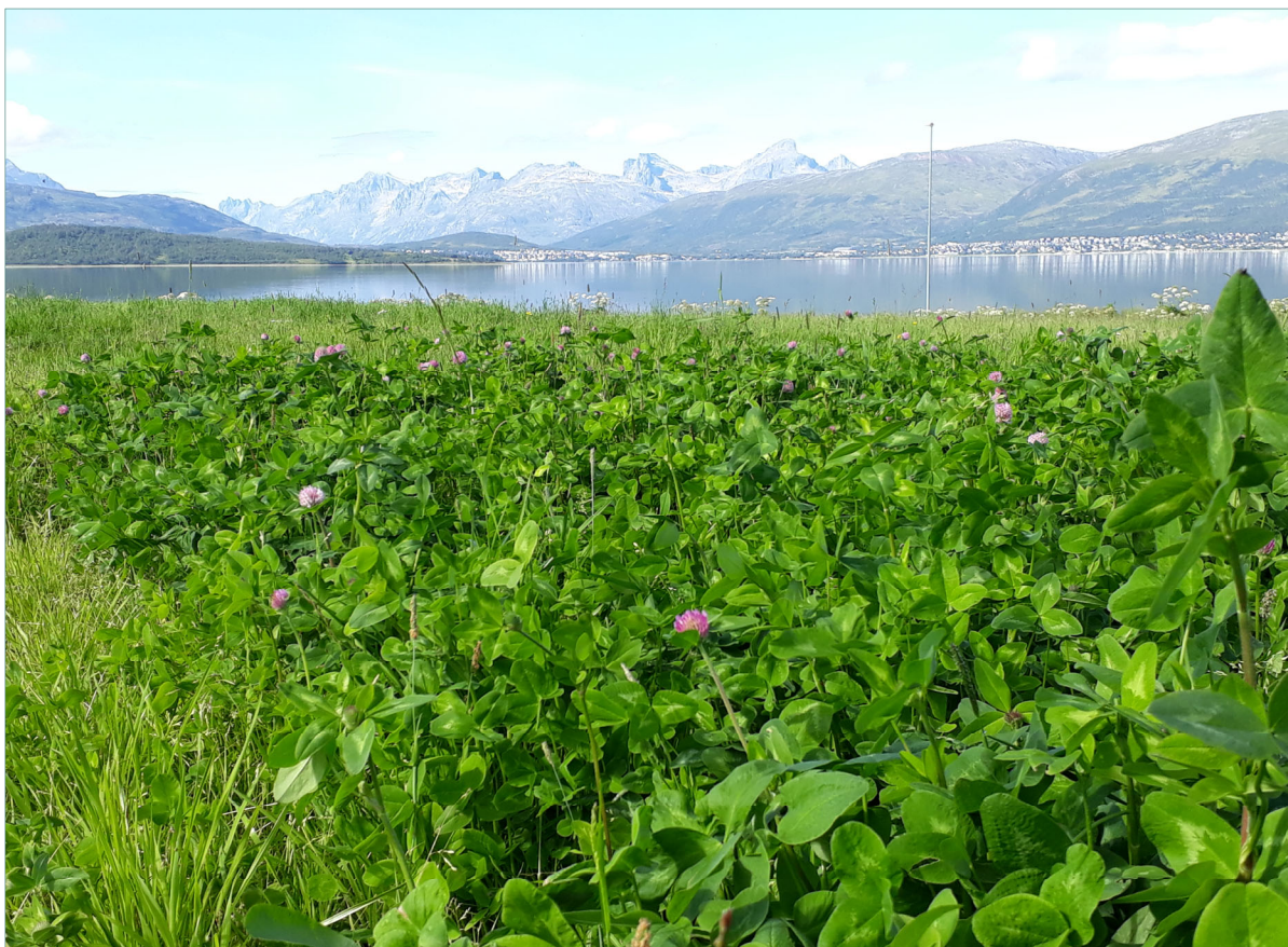
Testing av engvekstar bør skje i heile landet, her av raudkløver på Holt i Tromsø

Vekstsesongen vil påverka korleis frøblandingar klarar overvintringa og opprettheld avling over år. I forsøket vil ein bruka same frøblanding til ulik haustefrekvens som vil variera med vekstforholda, dvs. to og tre slåttar, ev. tre og fire slåttar. Forsøket bør vera så landsdekkande som råd.