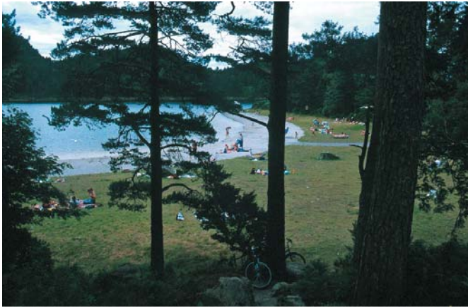
Bynær skog skal fylle mange ønsker og behov for befolkningen.

Skogforsk: tlf: 64 94 90 00, www.skogforsk.no ; Institutt for naturforvaltning: tlf: 64 94 89 00, www.umb.no/ina ; redaktør: Bjørn R. Langerud