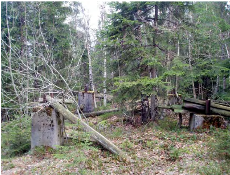
Rester av hoppbakken i Kolstadåsen.

93 Annet kulturminne: 2 (hoppbakke og en heller registrert som boplass) 12