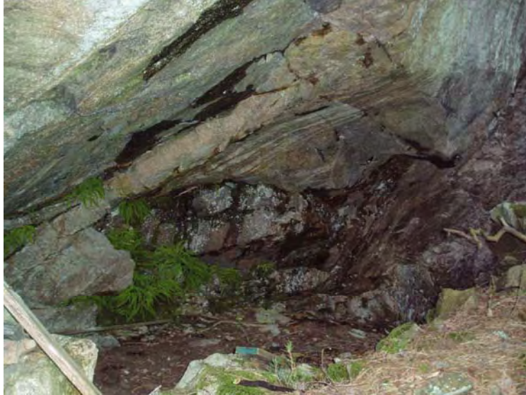
Heller som tidligere er registrert på Kolstadåsen.

Fra før er det i Frogn kommune registrert 292 lokaliteter med automatisk fredete kulturminner (eldre enn 1537). Av disse befinner 34 seg innenfor registreringsområdet. En lokalitet kan romme flere objekter og registreringene her teller 117 enkeltobjekter. Gravminner utgjør, ikke overraskende, brorparten av registreringene, se vedlegg 5.