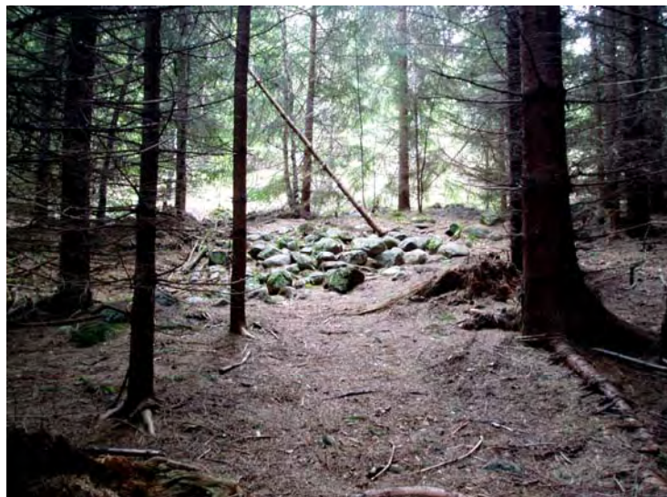
Rydningsrøis i Kolstadåsen.

Samlet registrerte Frogn Historielag 32 lokaliteter, hvorav enkelte rommer flere objekter, jf. vedlegg 7 og 8. Kontrollregistrering ble gjennomført i oktober, henholdsvis den 12. og 14. og 23. og omfattet 20 lokaliteter.