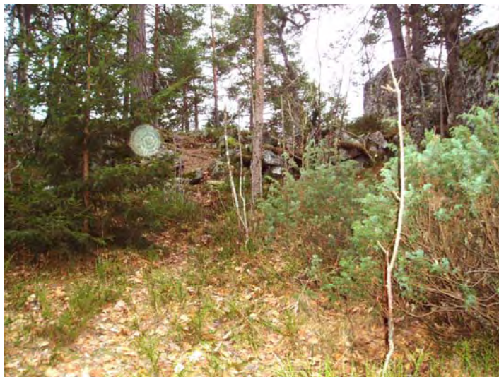
Bygdeborgen på Skanseåsen er synlig som en steinstreng.

Kart over undersøkelsesområdet viser i dag et helt annet kulturlandskap enn det som forelå da historielaget startet sine registreringer. Tilsynelatende funntomme arealer har fått en historie og sammenhengen mellom allerede kjente kulturminner er blitt tydeligere. Dette gjelder særlig bygdeborgen (ID 21696) på Øierud der de nyregistrerte hulveiene gjør lokaliseringen i landskapet ytterligere begrunnet. Dersom det viser seg at også gropene i samme område er gjenfylte fangstgroper for elg, understreker dette inntrykket av et intensivt utnyttet landskap i forhistorisk tid.