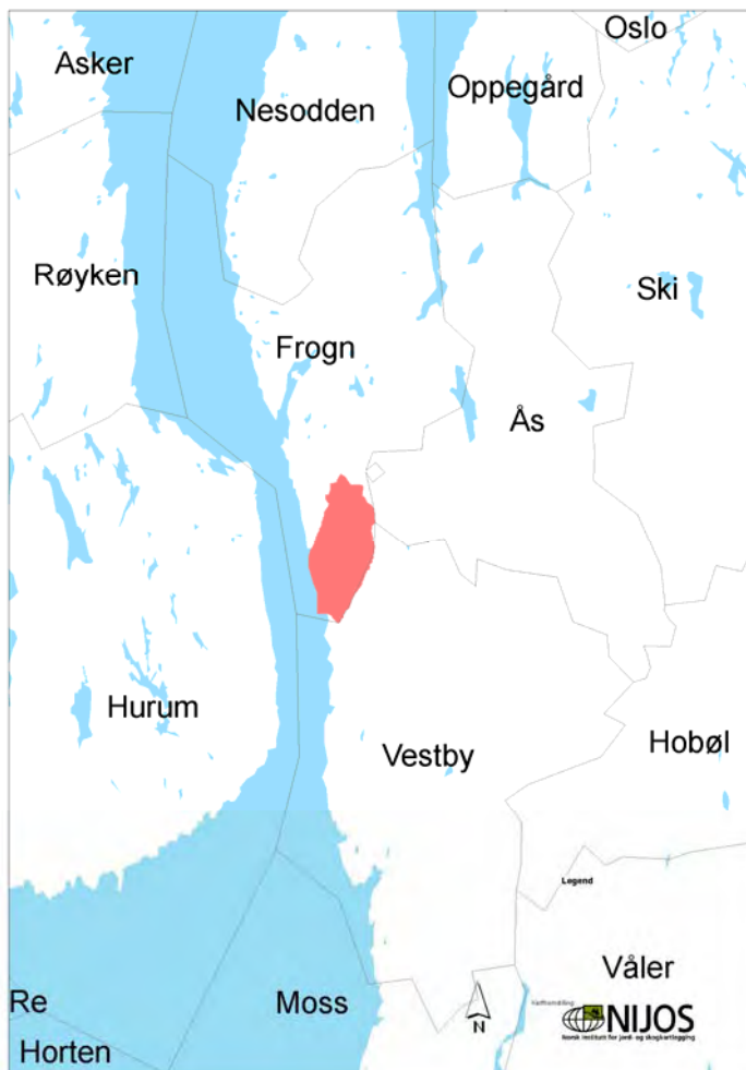
Kartet viser undersøkelsesområdet i Frogn 2004

Historielagets registreringer kom i berøring med følgende eiendommer: Odalen (gnr. 83 / bnr.1) Leium (gnr.3/ bnr.1), Ekeberg (gnr. 2/bnr.1, 5), Røis (gnr. 4/ bnr.1), Solberg nordre(gnr. 8 / bnr.2 ), Solberg øvre (gnr.7 / bnr.2), Ekesolberg (gnr.8/bnr. 1), Solberg nedre (gnr.7/ bnr.1),Krogsrud, øvre og nedre (gnr. 6 / bnr.1-2 ), Solberg søndre (gnr. 5/ bnr .1) Saga (gnr. 8 / bnr. 3), Øierud, søndre og nordre (gnr.10 / bnr. 1-2), Kolstad (gnr.12/ bnr.1-4). Haver, søndre, nordre og mellom (gnr.9 / bnr. 1-2-3), Krogsrudsand (gnr. 6 / bnr .4)