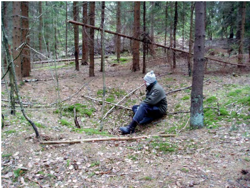
En av flere mulige fangstgroper for elg i Kolstadåsen. Området har senere vært dyrket og dette er trolig årsaken til at gropene i dag er gjenfylte.

Reg: 208: Registrert som hulvei, men minner mer om en gammel gutu/fegate.