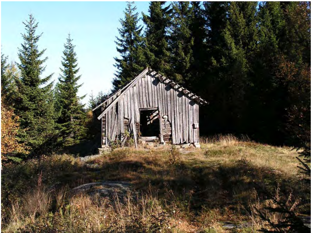
Illustrasjon: En av de bygningene som fremdeles står igjen på Herlandsetra.

Nordgårdsetra (4 H) Bøsetra Bergansetra Smukkestadsetra Engelstadsetra Tveitensetra Hvisle seter Hvisle seter vestre Holtansetra Søndre Hvalsetra Nordre Hvalseter