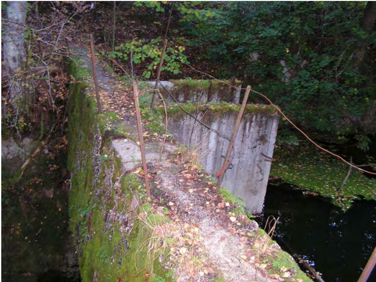
Illustrasjon: Liadammen (reg. 3419) er fremdeles godt synlig.