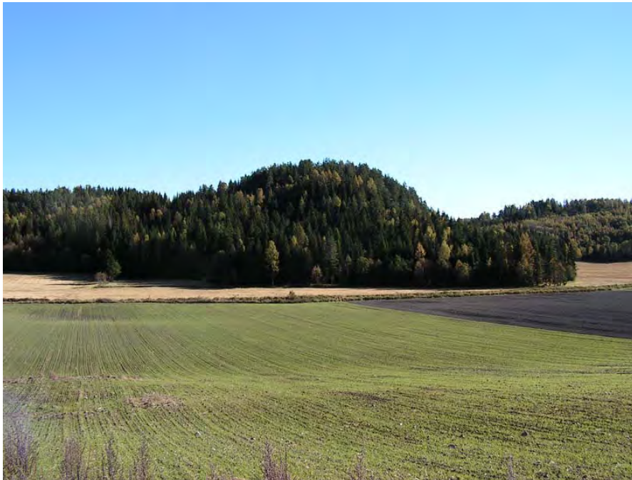
Illustrasjon: På denne kollen i Horntvedt ligger bygdeborgen Borgaren (reg. 001039). Hele høyden er markert som et automatisk fredet kulturminne.

Målingene viser at 62 % av registreringene ligger innenfor kravene til stedfestingskvalitet i AREALIS. For 12 av 15 registreringer er avviket mindre enn fem meter. Imidlertid er det her viktig å merke seg at 11 av de 12 målingene gjelder flater, som gir større sannsynlighet for treff enn enkeltpunkter. Som nevnt er det en registrering som viser et markant stedfestingsavvik 125 , uten at vi kan utdype årsaken til dette nærmere. Avviket dokumenterer hvor viktig det er at beskrivelsen av kulturminnet følger som vedlegg til kartet.