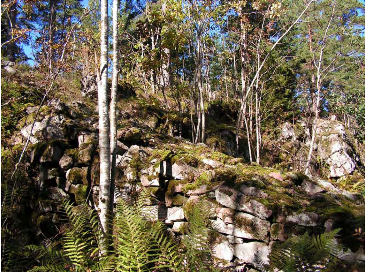
Illustrasjon: Hoppbakken "Huppen" (reg. 208) har et solid bygget overrenn i stein.

I forbindelse med utviklingen av et standardisert registreringsopplegg for det frivillige kulturminnevern, har NIJOS i samarbeid med historielagene i Idd og Enningdalen i Østfold og i Frogn, Akershus, testet ut et registreringsopplegg som er utviklet i regi av prosjektet Miljøregistreringer i skog – delprosjekt kulturminner (MiS-kulturminner) til bruk i skogbruksplanlegging. Dette består av kurs i kulturminneregistrering, skjemaer, begrepsapparat, veiledning til dette og en arbeidsinstruks. Begrepsapparatet er organisert i ni kategorier med 31 typer som skal favne alle typer kulturminner uavhengig av alder og vernestatus. Et kodeverk bestående av to sifre kan erstatte verbalbeskrivelsen. Kategorien "Bosetting og dyrking" er således inndelt i henholdsvis: