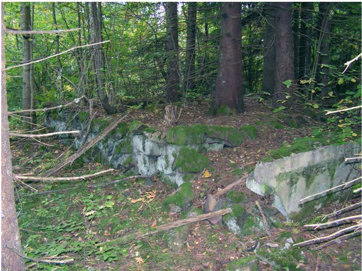
Illustrasjon: Tuftene etter husmannsplassen Lia søndre (reg. 3403) er fremdeles god synlige.

Ytterligere to registreringer fant vi bare frem til med prosjektleders hjelp 38