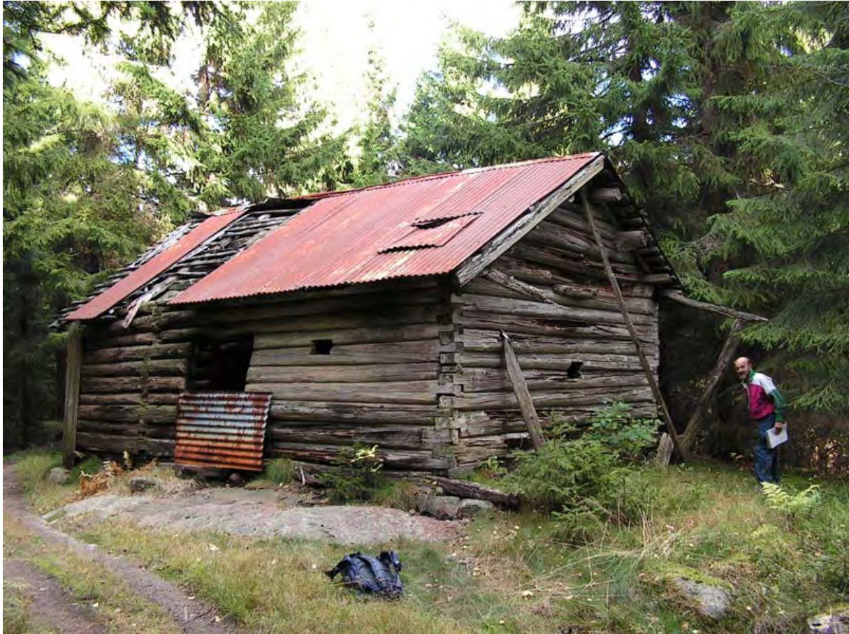
Illustrasjon: Størhuset på Herlandsetra med prosjektleder Tor Bjørvik.