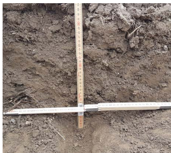
Bilde 2. Verktøyene lager tydelig løsningsspor i jorda.

Et av årsakene er at jordløsning med de valgte redskapene ikke løsner hele arbeidsbredden men lager tydelige løsningsspor i jorda (bilde 2) i motsetning til pløying der hele profilet (0–25 cm) løsnes. Dermed er det bare en del av undergrunnsjorda som løsnes, mens resten forblir pakket (Spoor 2006). Planterøttene møter derfor både løse og mer kompakte områder avhengig av vokseplassen. Dette gjenspeiles også i prøveresultatene, med stor variasjon i resultatene