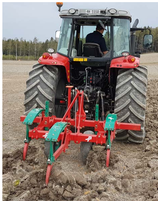
Bilde 1. Kverneland jordløsner.

Løsningen ble gjennomført høsten 2018 med to ulike typer redskap. Noen av de pakket rutene ble løsnet med jordløsner/grubb (Kverneland CLG II) ned til 35 cm dybde (bilde 1). Denne er forventet å ha både en løsne og en blandende effekt. Noen ruter ble løsnet med plog påmontert sålebryter der pløgen gikk ned til 25 cm og sålebryteren ned til 35 cm dybde. Alle rutene i forsøket ble deretter pløyd om høsten (Kverneland ES 85 med plogkropp 28, forplog og rulleskjær) med 25 cm arbeidsdybde. Om våren ble feltet kun harvet (6 cm) i to omganger før såing.