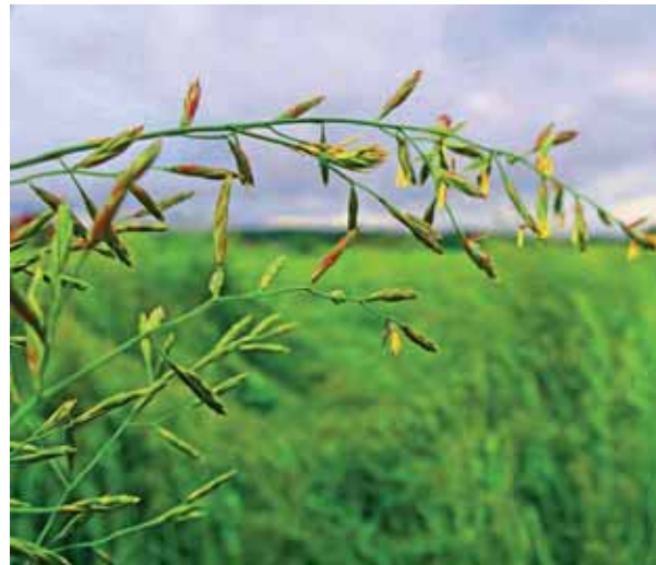
Bilde 1. Blomstring i frøenga med Vestar engsvingel på Landvik den 22. juni 2021.

Det var gunstige værforhold både under pollineringen i siste halvdel av juni og under frøhøstingen i midten av juli, og dette bidrog nok til de høye frøavlingene som ble oppnådd både på Landvik og i Tjølling, 98-133 kg/daa i gjennomsnitt (tabell 1).