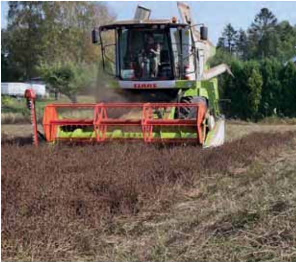
Bilde 4. Frøtresking 2. september 2021 av Lea rødkløverfrøeng som var svidd med 1,6 l Beloukha fem dager tidligere.