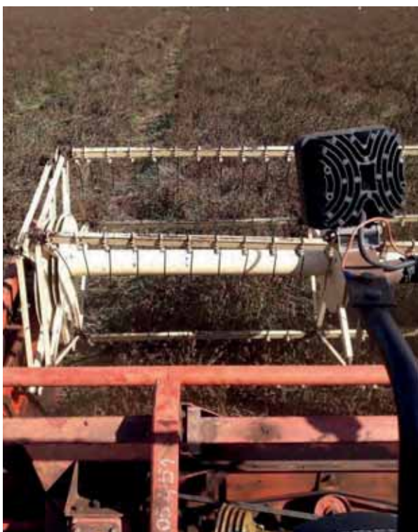
Bilde 3. Skårlegging av rødkløverfrøengda den 28. august 2021.

treskingen var 12 mm på oversåldet og 4-5 mm på undersåldet, mens vifta på renseverket ble satt til 500 r/min. Rutestørrelsen i feltet varierte fra 301 til 382 m 2 .