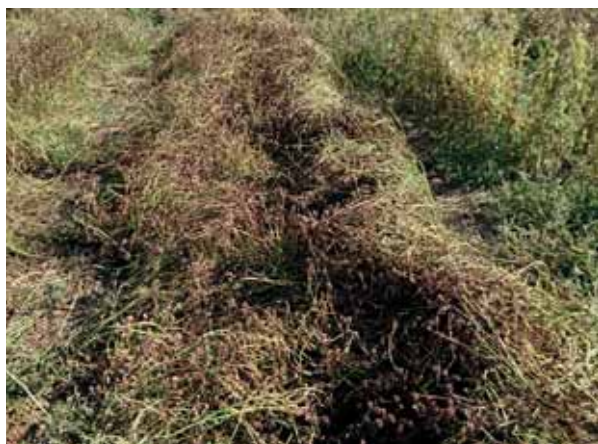
Bilde 2. Rute sprøytet med 1,6 l Beloukha/daa i to omganger i Råde-feltet, hvor fuktigheten i plante- og frømassen var lavest.

Økning av dysetrykket hadde ingen positiv effekt på frømassens tørrhet (ledd 4 vs. 12 og ledd 9 vs. 13).