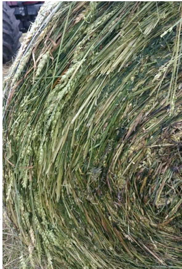
Høy, høyensilasje og heilgrødesurfôr av korn har oftast lågt innhald av E-vitamin