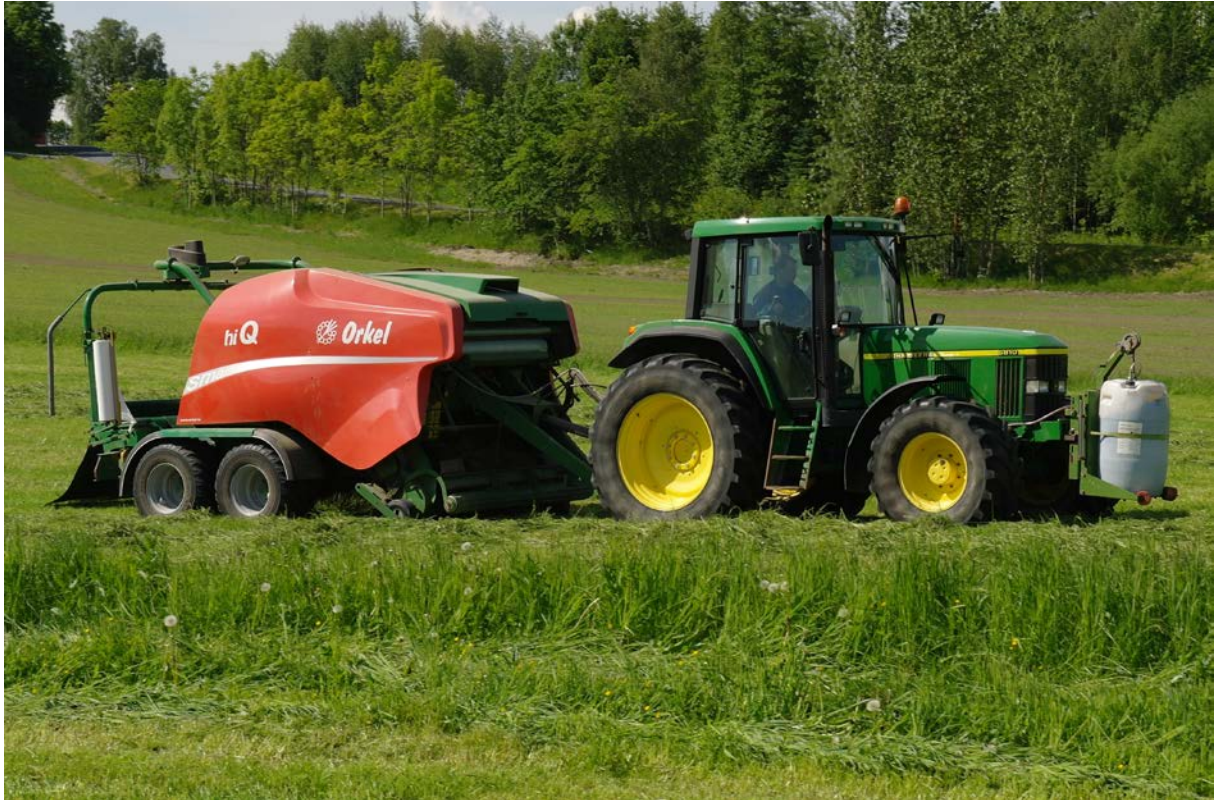
Surfôr av gras-kløver, hausta på ungt utviklingsstadium, er ei god E-vitaminkjelde.