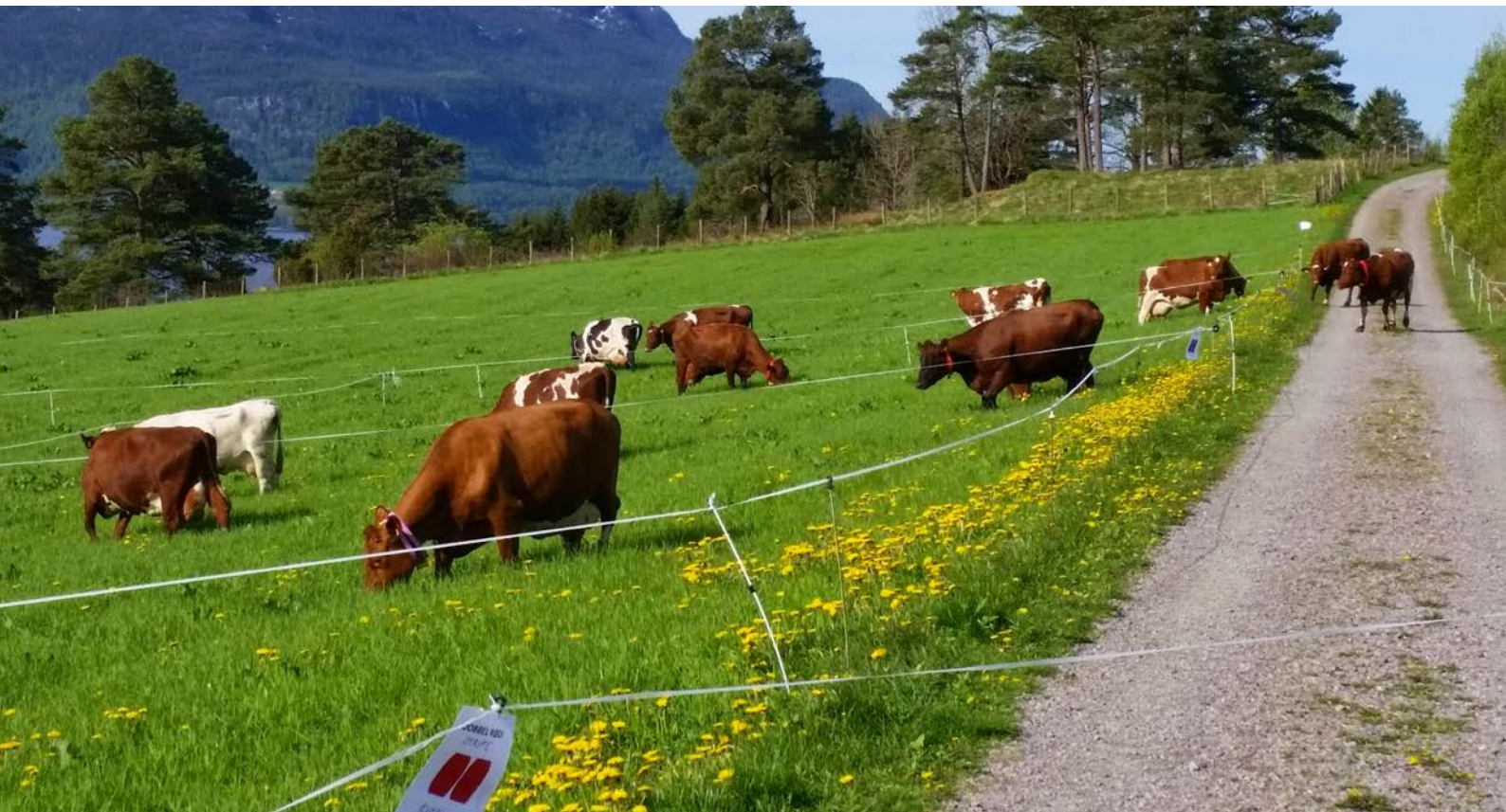
Kyr på beite treng vanlegvis ikkje ekstra tilskot med E-vitamin.