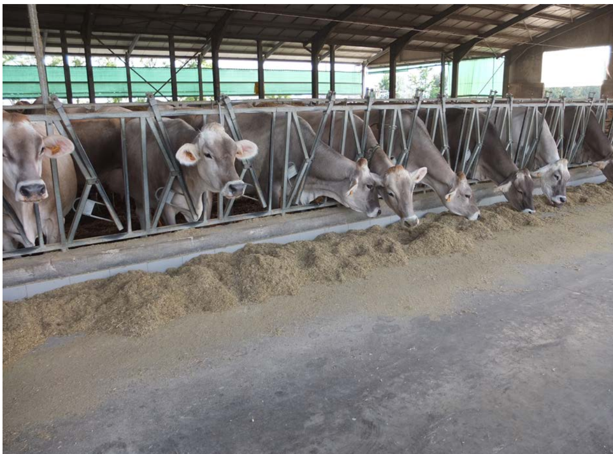
Mjølkekyr fôra hovudsakleg på heilgrødesurfôr av mais treng tilskot med E-vitamin.