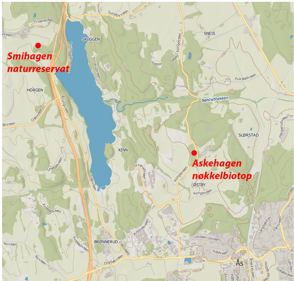
Figur 2. Lokalteter benyttet for test av attraktanter.