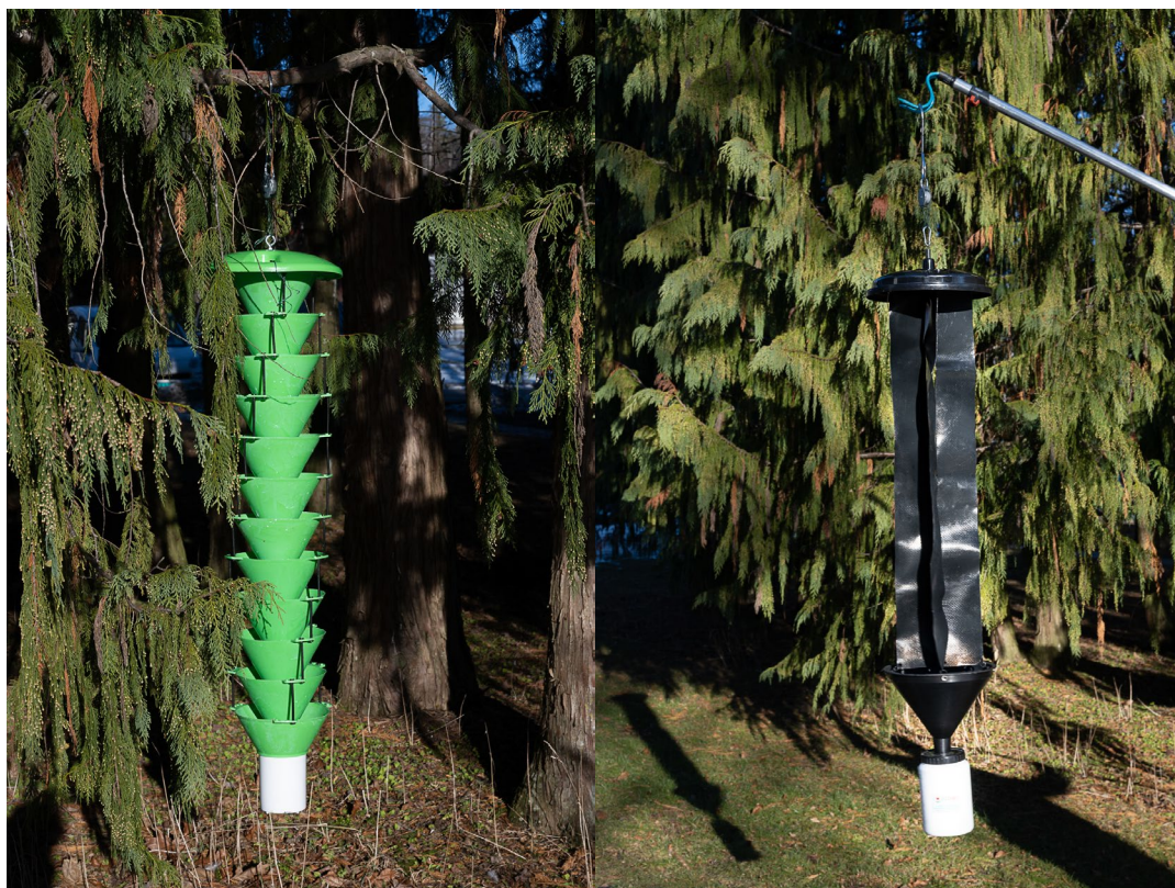
Figur 1. Multifunnel trap (venstre) og Cross trap (høyre).

I 2022 utarbeidet Mattilsynet en liste over lokaliteter som anses å ha høy risiko for introduksjon av fremmede insektssarter (Figur 4). Listen dekker kun regionene Midt, Stor-Oslo og Øst. Lokalitetene inkluderer stasjoner for avfallsgjenvinning, havner, importører/forhandlere av stein og flis, transportører, samt andre virksomheter hvor man finner importert treemballasje.